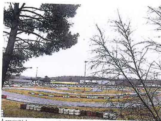
À proximité du parc se trouve le Racing Kart du Mans.

Avec l'arrivée des beaux-jours, le parc vous attend pour pique niquer, ou pratiquer une multitude de jeux : foot, basket, pétanque, skate.