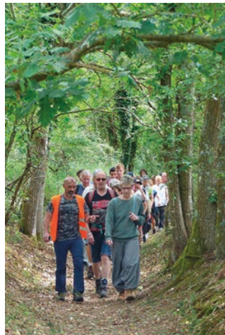
Pédestre = 65 randonneurs sur la journée.

Le public assez familial n'était pas forcément habitué à la pratique du Kayak mais se constituait également des kayakistes plus aguerris, tous ont apprécié de découvrir cette portion de rivière très préservée et la spécificité de l'animation qui combinait également des commentaires des deux sites de départ mais aussi du patrimoine et des ouvrages d'art présents au fil de l'eau.