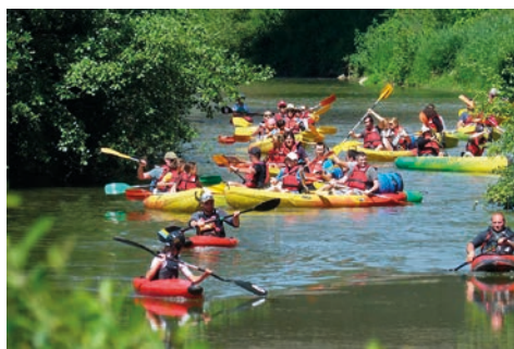
Kayak = 32 kayakistes